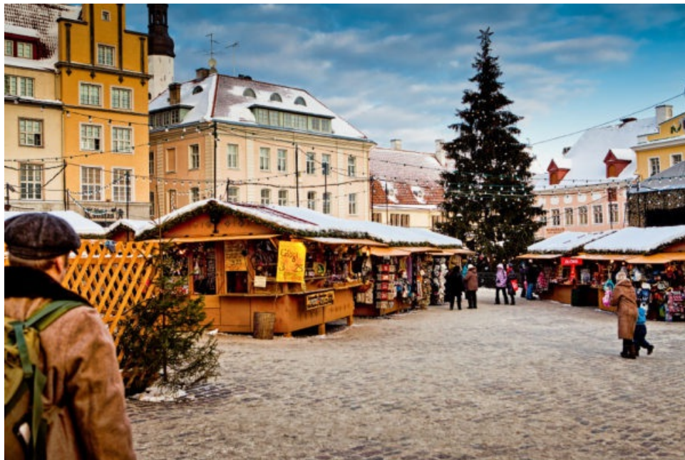
лакомства в Эстонии!

ый музей-театр «Легенды боты и фантастические редставят «вживую» 9 самых 5 евро, реб. до 14 лет – 10