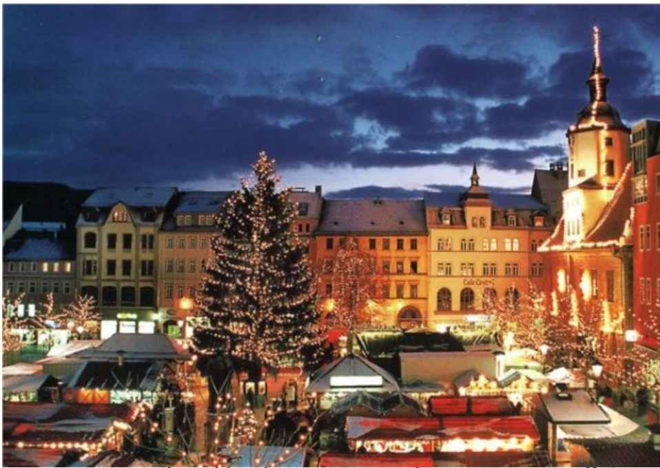
ЛАПЛАНДИИ – город Рованиemi расположена на

Полярном круге. Кто из нас не мечтал в детстве сесть к Деду Морозу на колени и узнать: ватная ли борода, почему такой красный нос, на чем он путешествует, есть ли у него помощники, откуда у него столько сладостей в мешке, какие подарки ожидать под ёлкой и многое другое. Говорят, что если шепнуть ему своё желание, то оно непременно сбудется! Здесь же, на Полярном круге, расположено почтовое отделение Санта-Клауса , откуда вы можете отправить открытку с маркой и автографом Санты. У вас будет возможность прокатиться на санях, запряженных собаками хаски или северными оленями , посетить Ледяной мир Снеговиков , покататься на ватрушках (доп. плата) и получить массу незабываемых впечатлений. В деревне так же находится огромное количество сувенирных лавочек, несколько ресторанов и кафе. Свободное время.